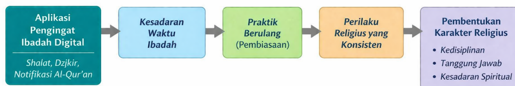
Gambar 1. Kerangka Konseptual Pembiasaan Ibadah Digital

Temuan ini dapat diinterpretasikan lebih lanjut melalui perspektif pembentukan karakter dalam pendidikan Islam. Data penggunaan aplikasi dan respons mahasiswa terhadap notifikasi digital menunjukkan adanya proses habituation yang berkontribusi pada pembentukan akhlak religius, seperti kedisiplinan, ketenangan, dan pengendalian diri. Notifikasi pengingat ibadah juga melatih nilai amanah, karena mahasiswa belajar bertanggung jawab terhadap kewajiban ibadah yang harus ditunaikan tepat waktu meskipun berada dalam situasi akademik yang padat. Selain itu, konsistensi merespons notifikasi mencerminkan praktik mujahadah , yaitu usaha sungguh-sungguh untuk melawan rasa malas dan distraksi duniawi demi menjaga ketaatan kepada Allah. Dengan demikian, tabel penggunaan aplikasi dan hasil wawancara tidak hanya menunjukkan frekuensi atau preferensi teknologi, tetapi juga mengindikasikan bagaimana teknologi digital berfungsi sebagai sarana tarbiyah modern yang membantu internalisasi nilai karakter religius secara bertahap dan berkelanjutan [43, 44].